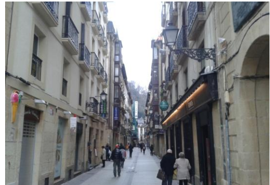
PARTE VIEJA SAN SEBASTIÁN

La Parte Vieja de San Sebastián es una de las zonas de la ciudad con mayor atracción turística , debido a que es una zona peatonal con una alta actividad comercial y también muy conocida por sus 'pintxos'. La afluencia de visitantes es muy importante ; desde Fomento de San Sebastián, se lanzó un proyecto denominado 'Smartkalea', en el que se instalaron sensores en una de las principales calles de la Parte Vieja, para la obtención de datos y así poder hacer una mejor gestión de la misma; se desplegó un sistema de conteo de personas y tracking que permitió obtener información precisa de la movilidad de las personas, las afluencias en las calles controladas y el origen/destino de las personas ; esta información resultó de gran utilidad al comercio y hostelería, así como al propio Ayuntamiento, que puede monitorizar en tiempo real la situación y actuar ante situaciones tales como aglomeraciones, etc.