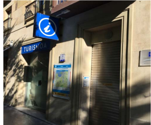
OFICINA TURISMO BOULEVARD DONOSTIA

San Sebastián es una de las ciudades de mayor atracción turística del Cantábrico; el incremento de visitantes en los últimos años ha sido muy importante, especialmente durante 2.016, con motivo de la Capitalidad Europea de la Cultura ; este incremento es continuo y en las dos oficinas de Turismo de la ciudad se recogen datos, pero es una información insuficiente de cara a poder ofrecer un servicio más adecuado a los turistas, con objeto de mejorar su experiencia en la ciudad; información como la afluencia real a las oficinas (ahora se dispone del dato de atenciones en el mostrador) ocupación y permanencia en distintos puntos de interés (mapas exteriores, escaparates, etc.), permitiría a Turismo de Donostia mejorar y adecuar el servicio a la demanda. Es por ello que, desde la Concejalía de Impulso Económico, a través de su sección de Turismo , se plantea un despliegue de sensores que de forma automática recojan esta información para su monitorización en tiempo real y su posterior gestión