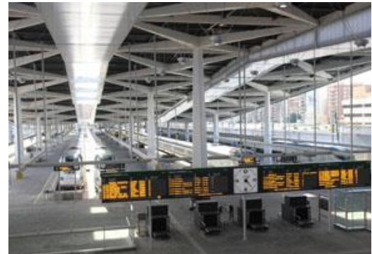
ESTACIÓN AVE JOAQUÍN SOROLLA

La Estación del AVE Joaquín Sorolla dispone de un amplio espacio para los pasajeros y acompañantes , con las zonas de venta de billetes, cafetería, consigna, parking y varios locales comerciales; esta zona está delimitada por los accesos a andenes para entrada y salida de pasajeros y los accesos exteriores (cafetería, parking y entradas principales). El tránsito de pasajeros es elevado y los tiempos de estancia son relevantes en muchos casos, por lo que una gestión adecuada de los espacios, ofreciendo servicios de interés, puede generar una experiencia positiva en el pasajero; ello requiere disponer de información de flujos de personas, ocupación, estancias medias , etc. de modo que se pueda gestionar el espacio de una forma más óptima. En la actualidad no se dispone de un sistema fiable de conteo de personas, herramienta fundamental para realizar una gestión óptima del espacio.