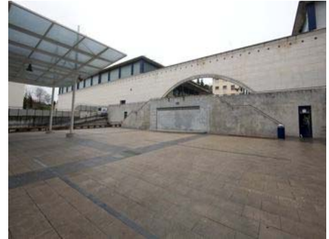
POLIDEPORTIVO MUNICIPAL DE EGIA

El Patronato Municipal de Deportes de San Sebastián, Organismo Autónomo perteneciente al Ayuntamiento, gestiona la red de polideportivos de la ciudad; conforman esta red un total de 11 polideportivos , que dan servicio a toda la ciudad. Actualmente se dispone de información del número de usuarios que asisten a cada polideportivo, bien con su tarjeta de asociado o bien por la compra de tickets individuales; sin embargo, no se dispone de información del uso de las instalaciones interiores (gimnasios, piscinas, etc.) ni su ocupación en cada momento, por lo se hace compleja la gestión de estos espacios; el usuario tampoco conoce la situación actual o previsión de ocupación , con lo que puede encontrarse con situaciones de saturación al acudir a las instalaciones. Se trata de desplegar una solución que aporte información tanto a los gestores como a los usuarios de la ocupación de las instalaciones para optimizar la gestión y ofrecer un mejor servicio a los usuarios.