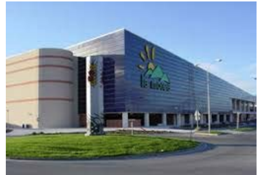
CENTRO COMERCIAL LA MOREA

El Centro Comercial La Morea fue la primera gran superficie construida en Navarra; se inauguró en octubre del año 2.002 ; con más de 15 años de recorrido, sigue siendo hoy la gran superficie referente de la zona . Cuenta con un aparcamiento con capacidad total de 2600 plazas gratuitas , más de 100 tiendas , 14 restaurantes , multicines , un hipermercado Leclerc y una de las principales tiendas FNAC de España. Se encuentra enclavado en una zona de gran actividad comercial, rodeada de medianas superficies y con unos accesos rápidos desde la autopista. En la actualidad no disponía de un sistema de conteo de personas automático, realizándose puntualmente algún conteo manual; tampoco se conocía cómo era el tránsito interno, por lo que la gerencia del centro decidió adquirir un sistema de conteo que en tiempo real facilitara esta información, con un alto nivel de precisión para mejorar la gestión